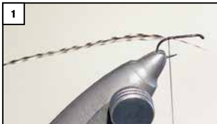
1 Haken einspannen, eine Grundwicklung legen und Hechel einbinden