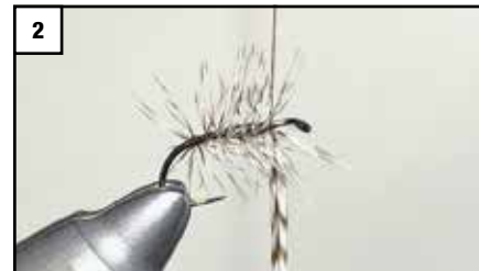
2 Hechel gepalmet einbinden und vor dem Ohr abfangen