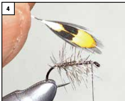
4 Eine Jungle Cock-Feder in der passenden Größe aussuchen