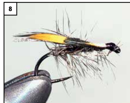
8 Die fertige Jassid