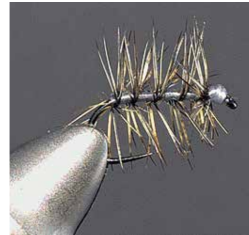
Spärlich gebunden – die Apotheker

Die Apotheker ist eine Herbstfliege, die von der Wiesent in der Fränkischen Schweiz stammt, aber auch an anderen Flüssen die Fische zum Steigen bringt. Es ist eigentlich eine ganz einfache Fliege, die mit wenig Material gebunden wird. Eine gepalmete Hechel ist eigentlich schon alles. Stehen die Fische auf Minimahlzeiten, ist sie ab #18 ein wahres Ass in der Box. Hinter dem Muster steckt eine kleine Geschichte: Ein Apotheker fragte bei der ehemaligen Firma „Bavaria Fischereigeräte“ in Hollfeld nach einer bestimmten Fliege – eben diesem Muster. Inhaberin Bischof nahm die Fliege später in ihr Sortiment auf. Da aber keiner mehr den Namen des Apothekers wusste, erhielt sie ganz einfach die Berufsbezeichnung als Titel. Sie wird in verschiedenen Farben gebunden. Neben der traditionellen Grizz-