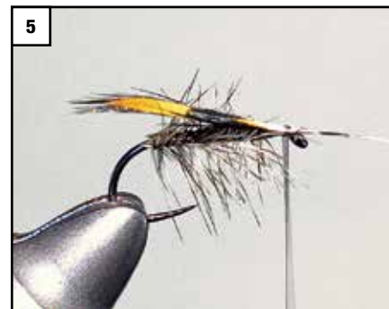
5 Anschließend die Feder oben einbinden