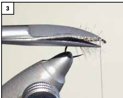
3 Jetzt die Hechel an der Oberseite kürzen