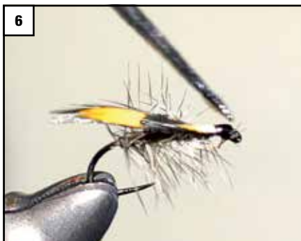
6 Das Federkielende abschneiden, einen kleinen Kopf bilden und Abschlussknoten machen. Danach vorsichtig lackieren