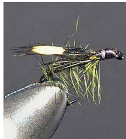
Einfach, aber fängig – die Jassid

Sie ist eine historische Fliege, die auch heutzutage eine Garantie für gute Fänge bietet – speziell im Herbst. Bereits vor 50 Jahren fand sie schon Erwähnung durch Vince Mariano in seinem Buch: A Modern Dry Fly Code. Sobald sich die Fische auf kleine Mahlzeiten spezialisieren, gehört die Jassid zur ersten Wahl des Autors. Sie imitiert verschiedene Insektenarten wie Midges oder Zuckmücken, die auf der