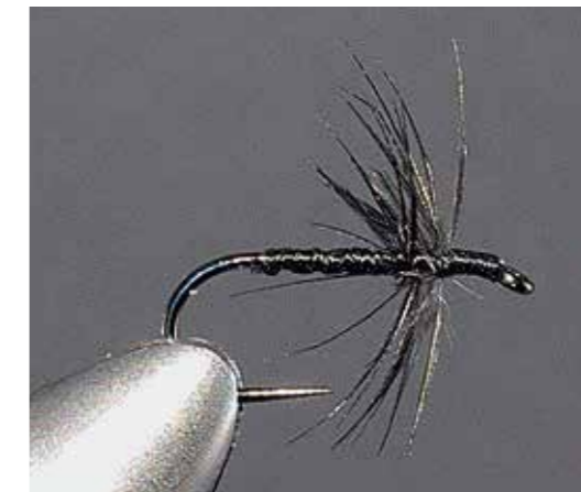
Braucht fast kein Bindematerial – die Black Spider

Dieser Klassiker unter den Herbstfliegen ist auch der dienstälteste. Seit mehr als 200 Jahren findet die Black Spider Erwähnungen in alter Fliegenfischerlektüre. Schon früher wusste man dieses Muster zu schätzen. Der Autor modifiziert es für seine Einsätze und wählt eine feinere Hennenhechel. Anstelle die für Black Spider üblichen Haken #12 oder 14 nimmt Jan einen #18 oder 20. Sie imitiert übrigens eine Sedge Pupa mit kleinen Luftblasen am Körper. Bei der Farbwahl müssen Sie sich nicht festlegen. Jan setzt auf Schwarz. Sie ist eine Nassfliege, kann aber ein wenig eingefettet auch