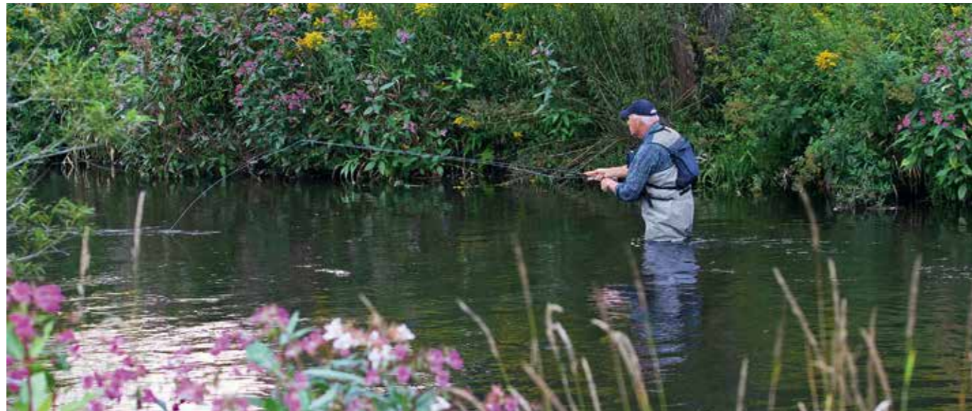
Der Autor beim konzentrierten Fischen mit einem Mini-Muster. Geht's Richtung Herbst, sind kleine Fliegen seine erste Wahl