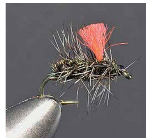
Schwänzchen am Kopf – die Griffith's Gnat